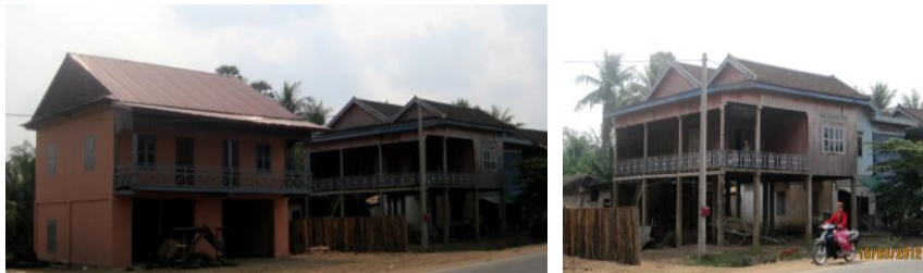
ภาพที่ 1.2 เรือนพื้นถื่นในเขตชนบทของชาวกัมพูชา ถ่ายเมื่อปี พ.ศ. 2555