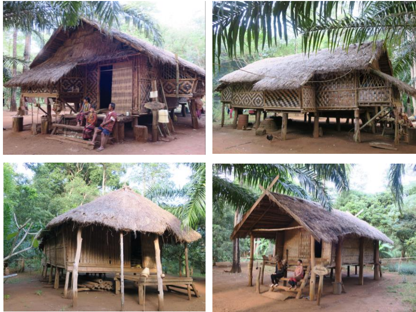
ภาพที่ 1.1 เรือนพื้นถื่นของชาวลาวตอนใต้ เมืองจำปาศักดิ์ ถ่ายเมื่อปี พ.ศ. 2559