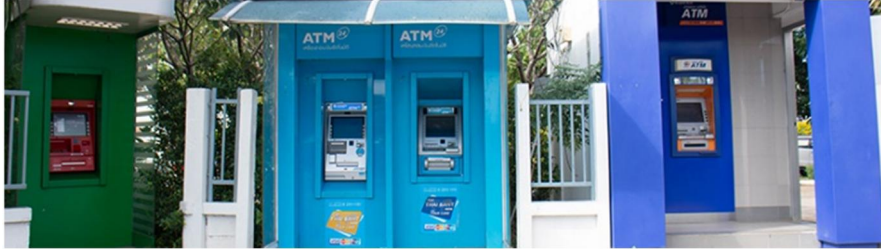
ภาพที่ 1.2 เทคโนโลยีที่ใช้ในการบันทึกข้อมูล ที่มา : ผู้เขียน

1.3.3 เทคโนโลยีที่ใช้ในการประมวลผลข้อมูล ได้แก่ เทคโนโลยีคอมพิวเตอร์ทั้ง ฮาร์ดแวร์ และซอฟต์แวร์