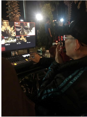
ภาพที่ 1.6 เทคโนโลยีสำหรับถ่ายทอดหรือสื่อสารข้อมูล