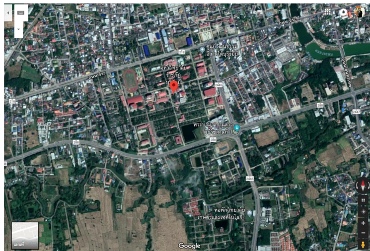
ภาพที่ 1.1 แผนที่ทางอากาศ

1.3.1 เทคโนโลยีที่ใช้ในการเก็บข้อมูล เช่น ดาวเทียมถ่ายภาพทางอากาศ กล้องดิจิทัล กล้องถ่ายภาพวีดิทัศน์ และเครื่องเอกซเรย์ เป็นต้น