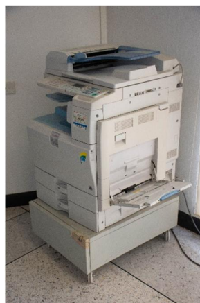
ภาพที่ 1.5 เทคโนโลยีที่ใช้ในการจัดทำสำเนาเอกสาร