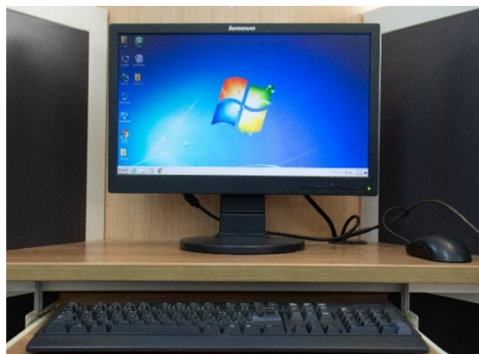
ภาพที่ 1.3 เทคโนโลยีที่ใช้ในการประมวลผลข้อมูล

1.3.3 เทคโนโลยีที่ใช้ในการประมวลผลข้อมูล ได้แก่ เทคโนโลยีคอมพิวเตอร์ทั้ง ฮาร์ดแวร์ และซอฟต์แวร์