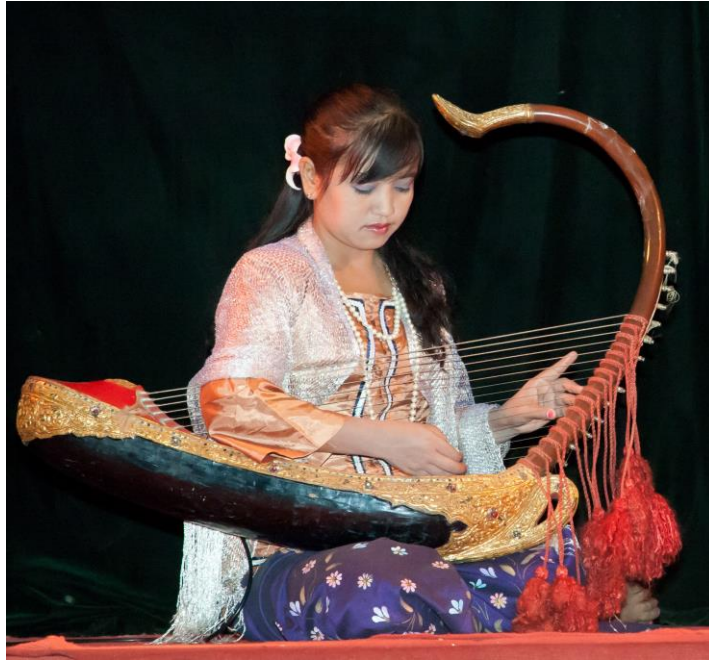
ภาพประกอบ 7.6 “ซอังก๊อ๊ก (Saung-Gauk)”