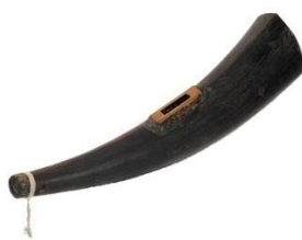
ภาพประกอบ 7.11 สะไน