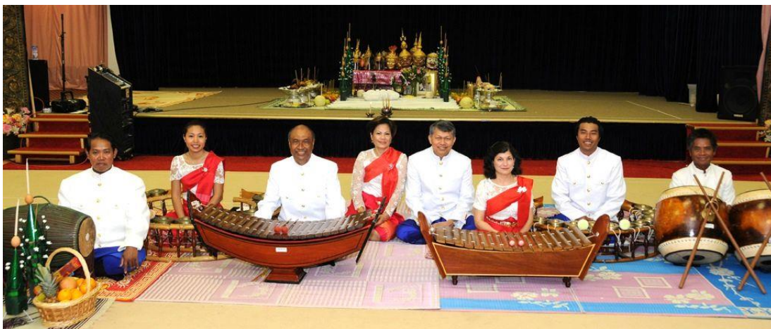
ภาพประกอบ 7.12 “วงดนตรี Pin-Peat”

ดังที่ได้กล่าวมาแล้ว เครื่องดนตรีกัมพูชาที่มีความหลากหลายจากการถ่ายทอดทางวัฒนธรรมของประเทศใกล้เคียงและเกิดการพัฒนามาเป็นของตนเอง จึงมีลักษณะคล้ายคลึงกับประเทศในแถบเอเชียตะวันออกเฉียงใต้ ได้แก่ ระนาด ฆ้อง ปี่ ขลุ่ย ซอ และกลองต่าง ๆ โดยผู้เขียนจะขอกล่าวถึงวงดนตรีและเครื่องดนตรีกัมพูชาโดยสังเขปดังนี้