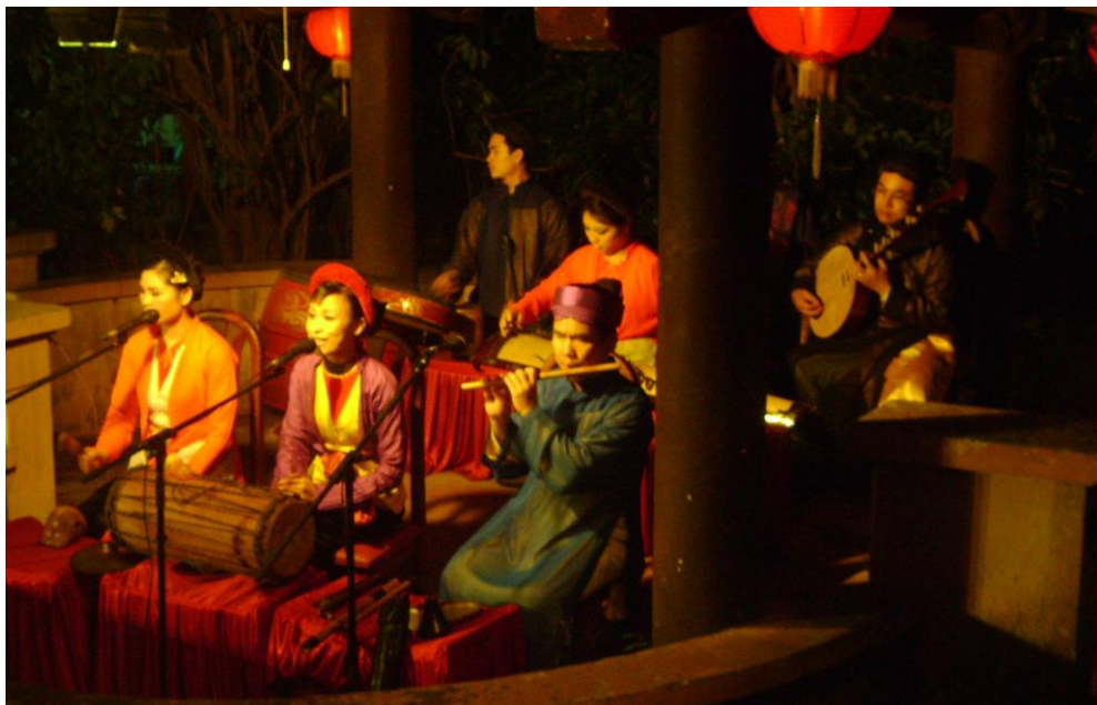
ภาพประกอบ 7.24 Mua Roi Nuoc