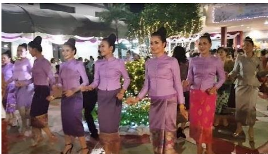
ภาพประกอบ 7.9 รำวงบัคสลอบ (Paslop Dance)

วัฒนธรรมดนตรีลาวเป็นที่ทราบกันคืออยู่แล้วว่าเครื่องดนตรีประจำชาติของลาว คือ “แคน” และวงดนตรีของลาวก็คือ “วงหมอลำและหมอแคน” ซึ่งท่วงทำนองของการขับลำจะแตกต่างกันไปตามกลุ่มชน รวมถึงการแสดงที่เรียกว่า “รำวงบัคสลอบ (Paslop Dance)” (ดังแสดงในภาพประกอบ 7.9) เป็นการเต้นออกท่าทางตามจังหวะเพลงอย่างพร้อมเพรียงและเป็นระเบียบ ถือได้ว่าเป็นเอกลักษณ์ของประชาชนคนลาว เพื่อความสนุกสนานร่วมกันในงานรื่นเริง งานมงคล หรืองานเทศกาลต่าง ๆ