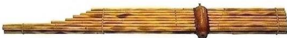
ภาพประกอบ 7.10 แคน (ปี่ลูกแคน)

1.4.1 แคนหรือปี่ลูกแคน เป็นเครื่องเป่าประเภทมีลิ้นที่ทำจากแผ่น โลหะ เสียงเกิดจากลมผ่านลิ้นไปตามลำไม้ที่เป็นลูกแคน การเป่าแคนต้องใช้ทั้งเป่าลมเข้าและดูดลมออกที่ต้องอาศัยความชำนาญและความสามารถพิเศษ แคนมีหลายขนาดตามจำนวนลูกแคน (บางขนาดมีเสียงประสานอยู่ด้วย) นอกจากแคนจะใช้เป่าบรรเลงเดี่ยวแล้วยังสามารถบรรเลงเป็นวง และบรรเลงประกอบการรำ (การขับลำ) หรือการใช้บรรเลงร่วมกับพิณหรือโปงลาง (ดังแสดงในภาพประกอบ 7.10)