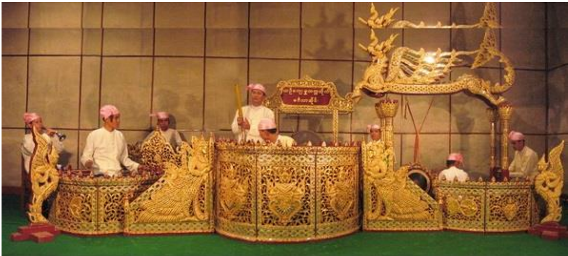
ภาพประกอบ 7.1 “วงชาวยาย (Hsaing-Waing)”