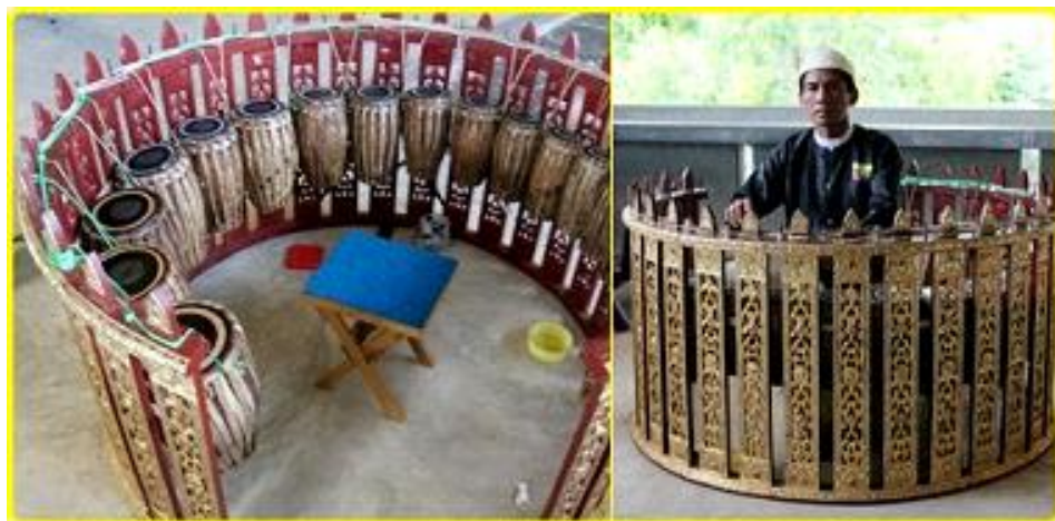
ภาพประกอบ 7.2 “ปัดตววย (Patt-Waing)”