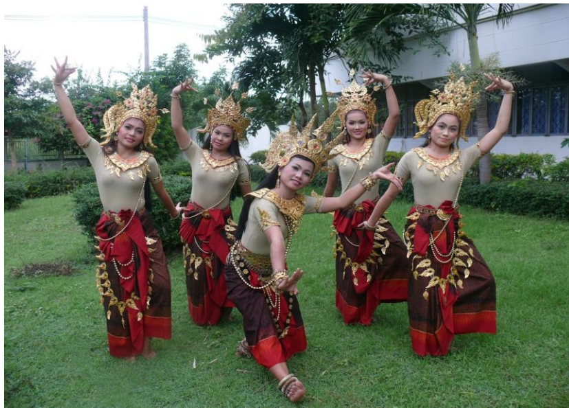
ภาพประกอบ 7.15 ระบุว่าเทพอัปสร (อัปสรา)