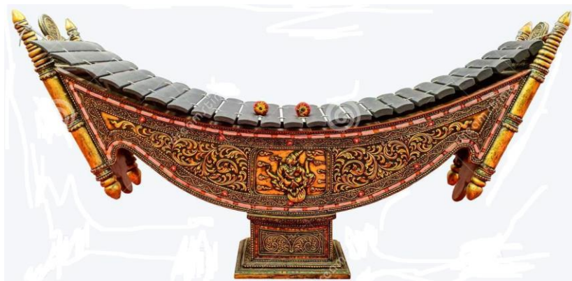
ภาพประกอบ 7.7 “ปัตตาลา (Pat-Tala)”

ซอังก๊อ๊กมีรูปร่างโค้งงอนมี 14 สาย ทำด้วยไหมดิบพันด้วยมือ (ปัจจุบันใช้ในลอนสีแดง) สายของซอังก๊อ๊กจะผูกติดกับเชือกที่พันไขว้ไว้กับคันทวนด้วยเงื่อนปมพิเศษ และตั้งสาย 5-7 เสียง สามารถเลื่อนให้ตึงหย่อนเป็นการปรับระดับเสียงเพื่อเปลี่ยนสำเนียงได้ด้วยการหมุนหรือเลื่อน ขึ้นลงเล็กน้อย นักวิชาการบางท่านอ้างว่าพิณชนิดนี้มีความสัมพันธ์กับฮาร์พของชาวเมโสโปเตเมีย และพงสาวดารพม่าได้กล่าวถึงพิณฮาร์พที่เมืองพุกาม (Pagan) มีหลักฐานว่าได้รับอิทธิพลจากอินเดียในช่วงศตวรรษที่ 11-12 (นัฏฐิกา สุนทรชนผล. 2557 : 95)