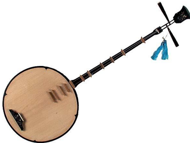
ภาพประกอบ 7.19 Dan Nguyet ที่มา (ดนตรีอาเซียน. 2557 : 87)

3.6 Dan Nguyet หรือ Dan Kim (พิณพระจันทร์) เป็นเครื่องสายประเภทดีด (ดังแสดงในภาพประกอบ 7.19) กล้องเสียงมีลักษณะกลม คล้ายกับ Chapei ของกัมพูชา และกระจับปี่ ของไทย มี 2 สาย ทำจากไหม (ไนลอน) ให้เสียงนุ่มนวล ระบบการเทียบเสียงเป็นคู่ 4 หรือคู่ 5 โดยไม่จำเป็นต้องมีมาตรฐาน เนื่องจากความสะดวกของผู้ขับร้องเป็นสำคัญ ใช้เทคนิคการดีดเข้าออกและกดบนตำแหน่งสายที่คั่นด้วยนมที่ตั้งขึ้น โดยใช้น้ำหนักของการกดสายที่เน้นเสียงเอื้อน (Bending Tone) ที่เป็นลักษณะเฉพาะของดนตรีเวียดนามนิยมเล่นทั่วไป พบทั้งในเวียดนามเหนือและเวียดนามใต้