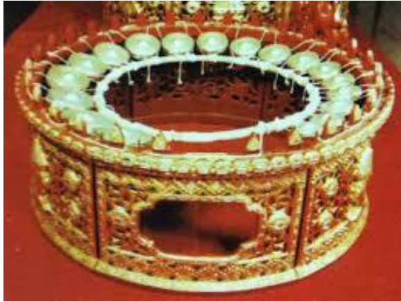
ภาพประกอบ 7.3 จีวาย (Kyi-Waing)