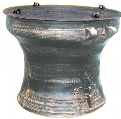
ภาพประกอบ 7.16 “มโหระทึก”

สมัยก่อนประวัติศาสตร์ชาวเวียดนาม (Vietnam) มีความคุ้นเคยและติดต่อกับพื้นที่ใกล้เคียงกับประเทศมหาอำนาจอย่างเช่น จีน และอินเดีย ทำให้ศิลปวัฒนธรรมเวียดนามผสมผสานกันเป็นกลุ่มตามยุคสมัย โดยขึ้นอยู่กับว่าชนกลุ่มใดจะเข้ามาปกครอง ราวพุทธศตวรรษที่ 1 - 4 มีชนกลุ่มหนึ่งที่อาศัยอยู่ทางตอนเหนือของเวียดนาม มีความเจริญรุ่งเรืองเป็นปึกแผ่นและมีอิทธิพลมาก เรียกว่า “ดองซอน (Dong-Son)” วัฒนธรรมดองซอนมีความเชื่อมโยงกับจีน อินเดีย เขมร และชวา ซึ่งเป็นที่รู้จักกันดีในเรื่องของ “มโหระทึก” (ดังแสดงในภาพประกอบ 7.16) กลองสัมฤทธิ์ที่มีอิทธิพลกระจายไปทั่วภาคพื้นเอเชียอาคเนย์