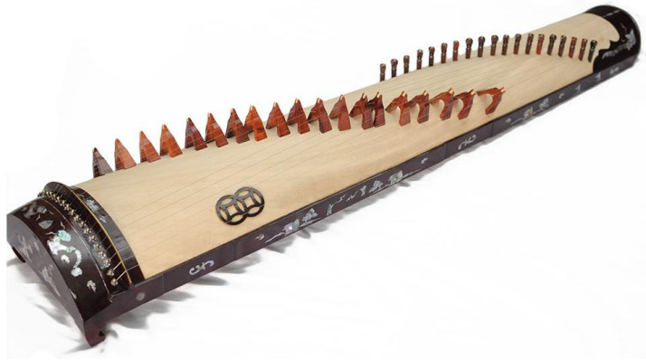
ภาพประกอบ 7.18 Dan Tranh ที่มา (ดนตรีอาเซียน. 2557 : 87)