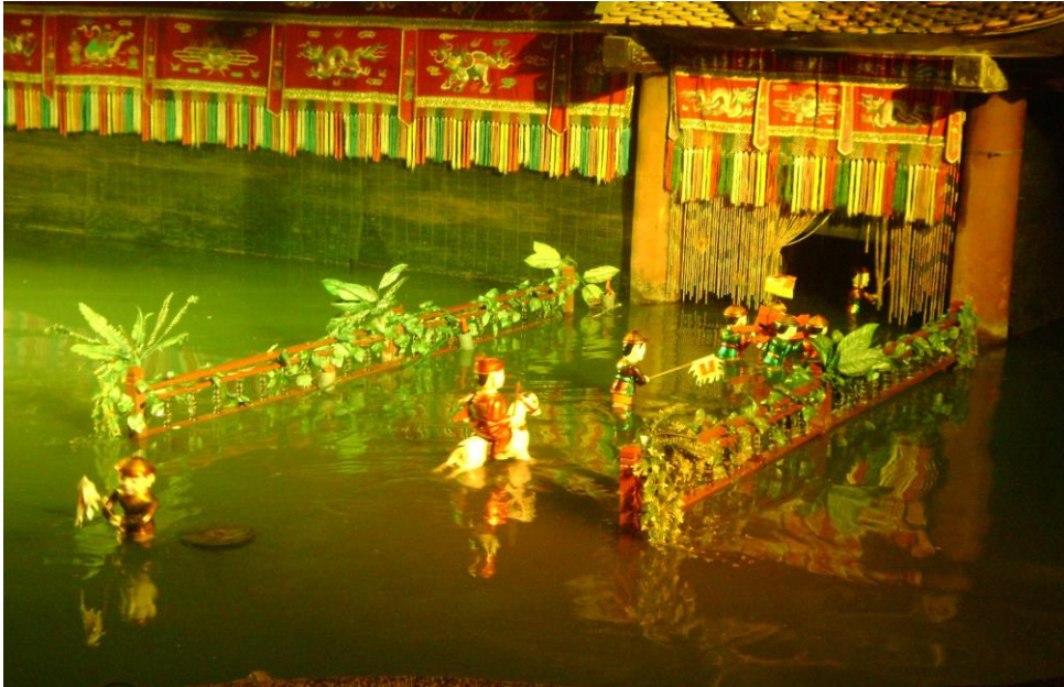
ภาพประกอบ 7.23 Water Puppet