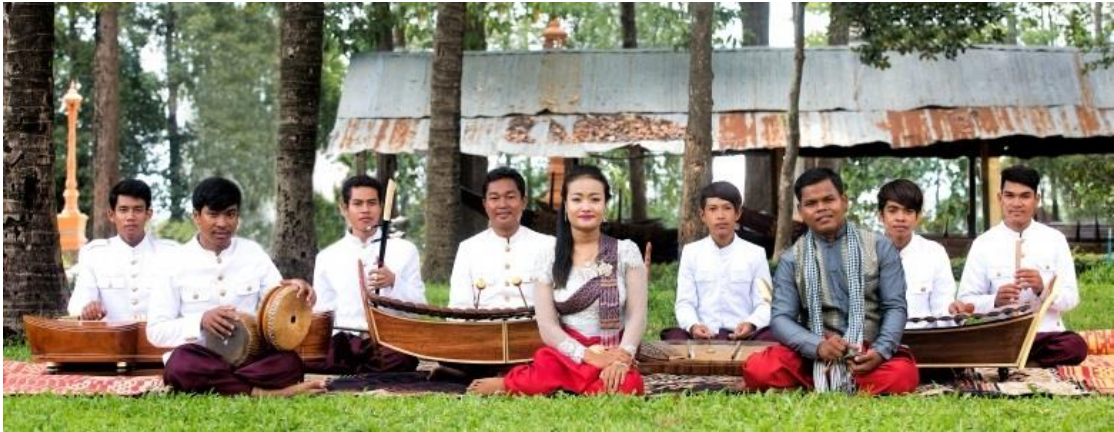
ภาพประกอบ 7.13 “วงดนตรี Mahori”