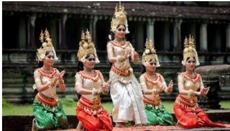
ภาพประกอบ 7.14 ระบุว่าอัปสรา