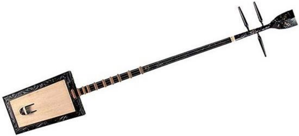
ภาพประกอบ 7.20 “Dan Day”