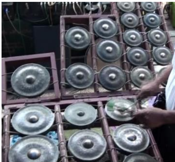
ภาพประกอบ 7.4 มองชาย (Maung-Zaing)

1.1.3 มองชาย (Maung-Zaing) หรือฆ้องรางซุด เป็นเครื่องดนตรีที่ประกอบด้วยฆ้องปทุมขนาดต่าง ๆ กันแขวนไว้กับรางที่เป็นกรอบไม้ตรง ๆ รูปสี่เหลี่ยม ไม่มีการประดับตกแต่งอย่างจีวาย มองชายมีลูกฆ้องทั้งสิ้น 18-19 ลูก เรียงกันเป็น 5 แถว รางฆ้องจะวางราบกับพื้น ยกเว้นกรอบที่บรรจุฆ้องลูกใหญ่ซุดที่เสียงต่ำที่สุดจะวางพียงไว้กับจีวายเมื่อออกแสดง มองชายเป็นเครื่องดนตรีที่ปรับปรุงขึ้นมาใหม่ในราวปีคริสตศักราช 1920-1930 (ดังแสดงในภาพประกอบ 7.4)