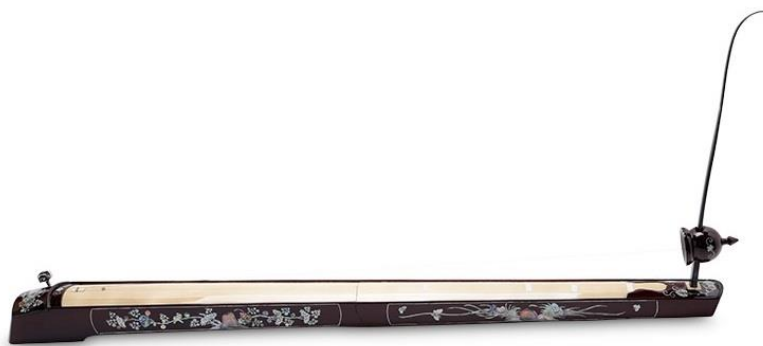
ภาพประกอบ 7.17 Dan Bau

3.3 Senh (Mouth Organ) เครื่องเป่าประเภท Aerophone มีลิ้นอิสระ คล้ายกับ Sheng ของจีน พบใช้บรรเลงในวงดนตรีพื้นบ้านของชนกลุ่มน้อย