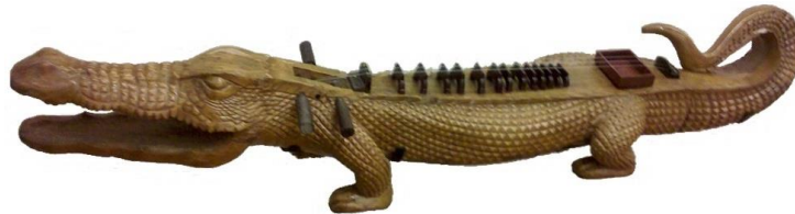
ภาพประกอบ 7.8 “มียอง (Mi-Gyaung)”

ปัตตalah หรือระนาดพม่า (ดังแสดงในภาพประกอบ 7.7) เป็นเครื่องตีที่ทำจากไม้ มีลูกกระนาค 24 ลูกให้ระดับเสียง 7 เสียง คล้ายกับระนาดเอกของไทย และกัมบัง (Gambang) ของชาวสามารถเล่นได้ทั้งบรรเลงเดี่ยว และประกอบการขับร้อง หรือเป่าขลุ่ย (Palwei)