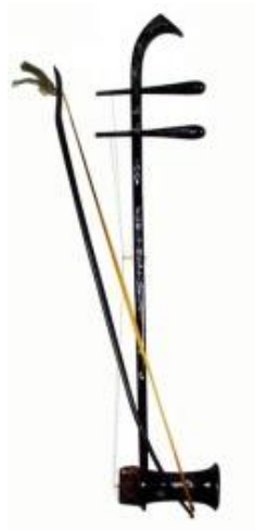
ภาพประกอบ 7.21 Dan Nhi