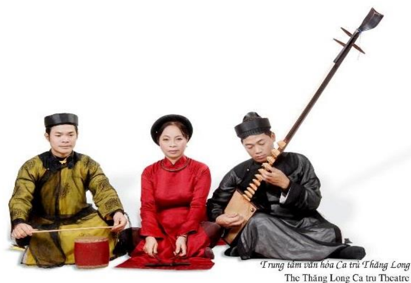
'Trung tâm văn hóa Ca tru Thăng Long The Thăng Long Ca tru Theatre

ดนตรีและการแสดงของเวียดนามมีหลายประเภท แต่ละประเภทมีหลายชนิด ซึ่งปรากฏให้เห็นได้ทั้งในเชิงประวัติศาสตร์และภูมิศาสตร์ในแต่ละระดับชนชั้นของสังคมเวียดนาม ทั้งดนตรีประกอบการแสดง ดนตรีบรรเลง ดนตรีพิธีกรรม และดนตรีชนกลุ่มน้อย ในที่นี้ผู้เขียนจึงขอกล่าวถึงลักษณะของดนตรีและการแสดงที่ควรรู้จักดังนี้