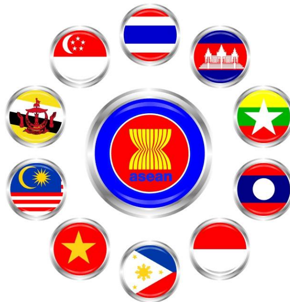
ภาพประกอบ 1.4 “ธงประเทศสมาชิกอาเซียน”

อาเซียนหรือสมาคมประชาชาติแห่งเอเชียตะวันออกเฉียงใต้ ปัจจุบันอาเซียนมีสมาชิกทั้งหมด 10 ประเทศ (ดังแสดงในภาพประกอบ 1.4) มีข้อมูลพื้นฐานโดยสังเขปดังนี้