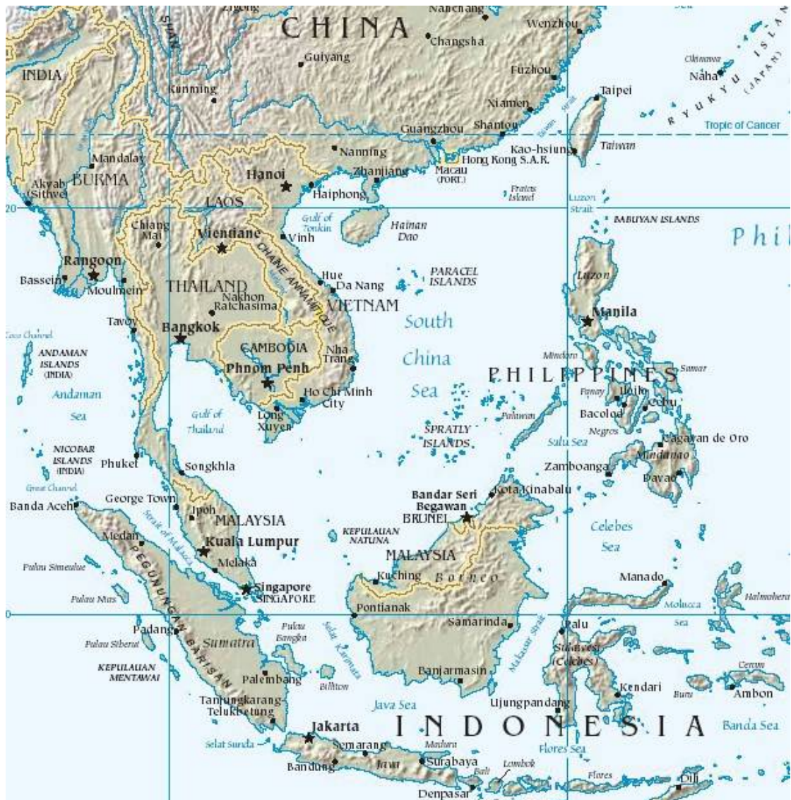
ภาพประกอบ 1.1 “แผนที่ภูมิภาคเอเชียอาคเนย์”

มีการศึกษาอย่างละเอียดถี่ถ้วนและพบว่า ไม่มีข้อพิสูจน์และหลักฐานใด ๆ ที่ทำให้เชื่อได้ว่า วัฒนธรรมของเอเชียอาคเนย์เกิดจากความเจริญภายนอก แต่มีหลักฐานว่าระบบการปกครองและการจัดการของจีนมีผลเพียงแต่ในเมืองเล็ก ตามท้องถิ่นเล็ก ๆ เท่านั้น แม้ว่าประวัติศาสตร์ช่วงท้าย ๆ ของยุคหินจะขาดต่อการตีความก็ตาม แต่ปัจจุบันนี้มีหลักฐานมากพอที่จะเชื่อได้ว่า ผู้คนในพื้นที่ได้สร้างสังคมอันสลับซับซ้อน ตลอดจนระบบการปกครองของตนขึ้นมา ก่อนที่จะได้รับอิทธิพลจากอินเดียเสียอีก (Miller, Terry E. & William S. 1998 : 39)