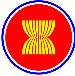
ภาพประกอบ 1.3 สัญลักษณ์ของอาเซียน