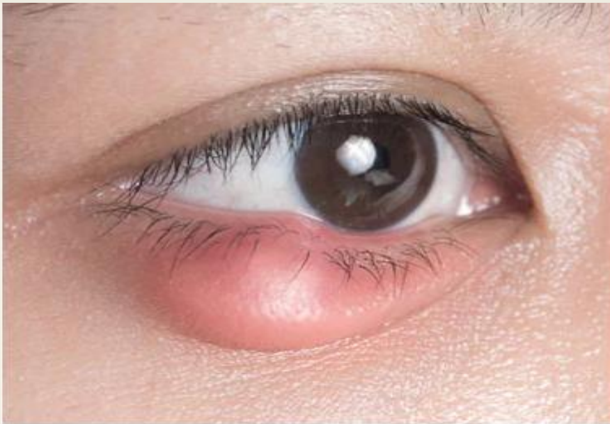
ตากุ้งยิงชนิดหัวพุด

แบ่งเป็น 2 ชนิด คือ 1. กุ้งยิงชนิดหัวพุด 2. กุ้งยิงชนิดหลบใน