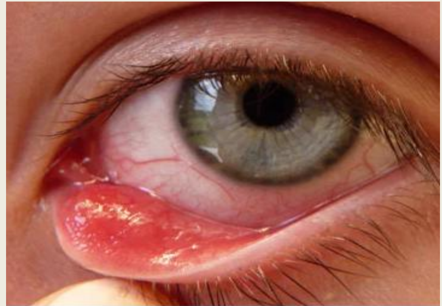
ตากุ้งยิงชนิดหลบใน