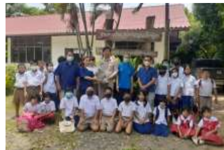
ภาพที่ 5.2 ศูนย์การเรียนรู้ชุมชนโอ้ไต้้น้อย