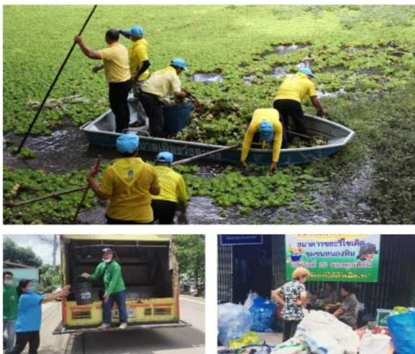
ภาพที่ 5.8 กิจกรรมการจัดการขยะของเทศบาลเมืองวังสะพุง

ประโยชน์ที่ประชาชนได้รับจากโครงการศีลธรรมกำจัดขยะ