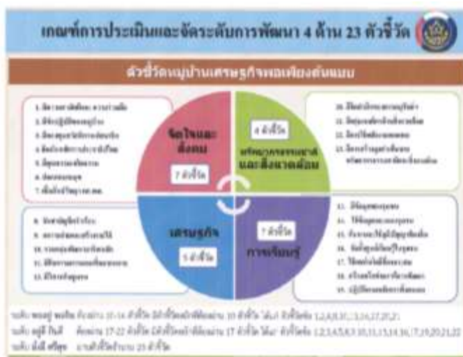
ภาพที่ 5.7 ตัวชี้วัดการประเมินหมู่บ้านเศรษฐกิจพอเพียง 4 ด้าน 23 ตัวชี้วัด

โดยสรุปการพัฒนาหมู่บ้านเศรษฐกิจพอเพียงต้นแบบ จึงเป็นการนำหมู่บ้านที่มีความพร้อม มีผลการปฏิบัติ ในการพัฒนาตนเอง ครอบครัว และชุมชน เพื่อให้เป็นสถานที่เรียนรู้ หรือแหล่งเรียนรู้ สำหรับหมู่บ้านอื่นๆ ที่ยังไม่ได้เริ่มต้นในการพัฒนาตามแนวปรัชญาของเศรษฐกิจพอเพียง การแยกประเภทหมู่บ้านเป็น 3 ระดับ ประกอบด้วย “พออยู่ พอกิน” “อยู่ดี กินดี” และ มั่งมี ศรีสุข” เพื่อใช้เป็นต้นแบบการเรียนรู้ ให้กับหมู่บ้านที่มีพื้นฐาน หรือสถานการณ์ของหมู่บ้านใกล้เคียงกัน สามารถเรียนรู้ เลียนแบบได้ นำไปประยุกต์ใช้ขยายผลในระดับท้องถิ่นเพื่อให้เกิดความมั่นคงยั่งยืนต่อไป