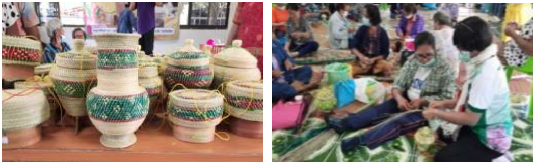
ภาพที่ 5.11 การสานกระติบข้าวสร้างรายได้ให้กับสตรีและผู้สูงอายุ

วิสัยทัศน์ขององค์การบริหารส่วนตำบลปากเรือ “ปากเรือเมืองน่าอยู่ ชุมชนเข้มแข็ง แหล่งผลิตเกษตรอินทรีย์” ผลการดำเนินโครงการเด่น “การส่งเสริมอาชีพเพื่อพัฒนาเศรษฐกิจท้องถิ่น หลักสูตรการสานกระติบข้าว” เป็นโครงการที่สร้างรายได้ให้กับสตรีผู้มีรายได้น้อยผู้สูงอายุ โดยการนำวัตถุดิบในท้องถิ่น ไม้ไผ่ กก มาแปรรูปกระติบข้าว การรวมกลุ่มสร้างชุมชนให้เข้มแข็ง ผลผลิตสามารถจำหน่ายในชุมชนและจำหน่ายผ่านระบบออนไลน์ กระติบข้าว เป็นของใช้ในครัวเรือนของชาวอีสาน และเป็นของฝากของที่ระลึก การพัฒนาความรู้ด้วยการออกแบบรูปทรง ลวดลาย ที่หลากหลาย เหมาะกับการเป็นของฝากของที่ระลึก