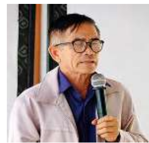
พ่อคำเตื่อง ภาซี