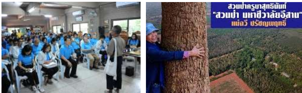
ภาพที่ 5.3 รับคณะศึกษาดูงาน และสภาพป่าที่สมบูรณ์

มหาชีวาลัยอีสาน ของพ่อครูบาสุทธินันท์ ปรัชญพฤทธิ์ ตั้งอยู่ที่บ้านปากช่อง ตำบลนามชัย อำเภอสตึก จังหวัดบุรีรัมย์ (พ่อครูบาสุทธินันท์ เสียชีวิตแล้ว) ต้นแบบของพื้นที่ คือ การพัฒนาพื้นที่ดิน ดอนที่ปลูกอะไรไม่ได้เพราะดินไม่ดีให้มาเป็นพื้นที่ที่มีความอุดมสมบูรณ์ พ่อครูบาได้มาปลูกป่าเป็นสิ่งนำ ความชุ่มชื้นให้ดิน ใบไม้เป็นปุ๋ยสร้างจุลินทรีย์ตามธรรมชาติ ทำให้ดินเริ่มดีขึ้นเรื่อยๆ เพราะมีปลูกไม้ ตามแนวทางของในหลวงรัชกาลที่ 9 ปลูกป่า 3 อย่างประโยชน์ 4 อย่าง ทำให้เห็นเป็นแบบอย่าง มีการ นำระบบน้ำใต้ดินมาใช้ในพื้นที่ พ่อครูบาสุทธินันท์ มีลักษณะพิเศษกว่าปราชญ์ทั่วไปคือการเขียนหนังสือ หรือถ่ายทอดความรู้มาเป็นเอกสารวิชาการเผยแพร่ความรู้สู่สาธารณะได้อย่างกว้างขวาง และเป็นผู้ที่ เรียนรู้ความรู้ใหม่ๆ อยู่ตลอดเวลา มหาชีวาลัยอีสานจึงเน้นการแปรรูปไม้ เพราะมีพื้นที่ป่ากว่า 200 ไร่ มี ไม้หลายระดับ ไม้โตเร็ว ไม้โตช้า ไม้กินผล ไม้สมุนไพร นำมาแปรรูปเป็นถ่านสำหรับเป็นเชื้อเพลิง แปรรูป ถ่านไบร์โอซา ที่มีเตาเผาถ่านไบร์โอซาที่ใหญ่ที่สุด นวัตกรรมเตาเผาที่เป็นจุดเด่น แปรรูปไม้สำหรับสิ่ง ปลูกสร้าง การทำเฟอร์นิเจอร์ ฯ เป็นต้น นอกจากนี้มีการปลูกพืชผักให้มีภูมิทัศน์ที่สวยงาม มีคณะ ศึกษาดูงานหน่วยงานต่างๆ จำนวนมาก เพราะมีฐานเรียนรู้หลายฐาน