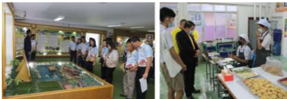
ภาพที่ 5.9 มีคณะศึกษาดูงานศูนย์เรียนรู้ของโรงเรียนเทศบาลบูรพาอุบล

นครอุบลราชธานีได้ส่งเสริมสนับสนุนให้โรงเรียนในสังกัดเป็นหน่วยในการเรียนรู้และขยายผลการนำหลักปรัชญาเศรษฐกิจพอเพียงไปใช้ในการดำเนินชีวิต และปลูกฝังทักษะอาชีพให้กับนักเรียนและชุมชน ภาคีเครือข่ายกว่า 106 ชุมชน และยังเป็นศูนย์เรียนรู้ที่ขยายผลสู่ผู้บริหาร ครู นักเรียนในโรงเรียนสังกัดเทศบาลนคร ซึ่งในศูนย์เรียนรู้จะมีรูปแบบการสาธิตองค์ความรู้ด้านต่างๆ อย่างเป็นรูปธรรมในลักษณะฐานเรียนรู้ เช่น โครงการแปลงเกษตรอัจฉริยะ (Smart Farm) โครงการปุ๋ยหมักแบบพลิกถัง (Compost) โครงการปลูกพืชปลอดสารพิษ (Hydroponic) โรงเรียนปลอดขยะ (Zero Waste School) โครงการทักษะด้านอาชีพ และการใช้โซลาร์เซลล์ในสถานศึกษา เป็นต้น ซึ่งเป็นฐานเรียนรู้ที่สามารถไปศึกษาเรียนรู้ ส่งเสริม บ่มเพาะปลูกฝังวิถีคิดให้สามารถดำรงชีวิตได้ด้วยตนเองตามหลักปรัชญาของเศรษฐกิจพอเพียงได้ ขณะเดียวกันโรงเรียนที่รับผิดชอบศูนย์เรียนรู้ได้เชื่อมโยงกับผู้รู้จากหน่วยงานต่างๆ เข้ามามีส่วนร่วมในการพัฒนาศูนย์เรียนรู้อย่างต่อเนื่อง