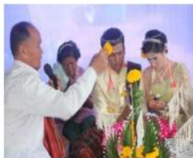
ภาพที่ 5.10 ปราชญ์ชาวบ้าน