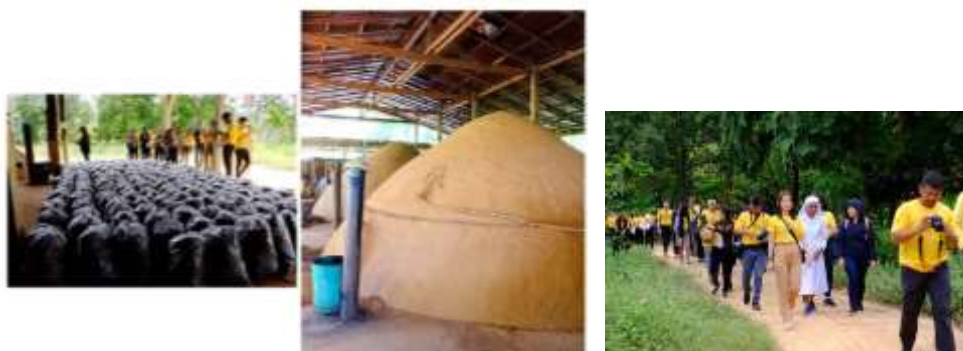
ภาพที่ 5.4 เตาเผาถ่านผลิตถ่านไบร์โอซา และถ่านเพื่อเป็นเชื้อเพลิง ฐานเรียนรู้ของมหาชีวาลัยอีสาน