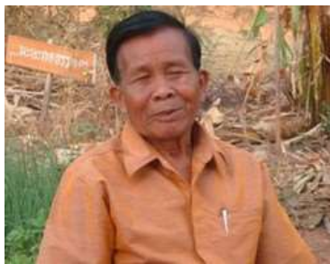
พ่อผาย สร้อยสระกลาง