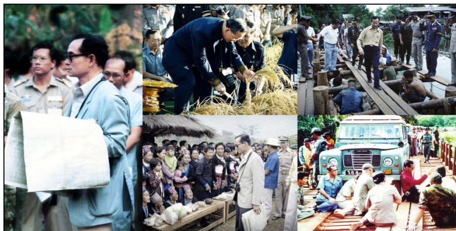
รูปที่ 3.4 พระราชกรณียกิจของพระบาทสมเด็จพระบรมชนกาธิเบศร มหาภูมิพลอดุลยเดชมหาราชบรมนาถบพิตร