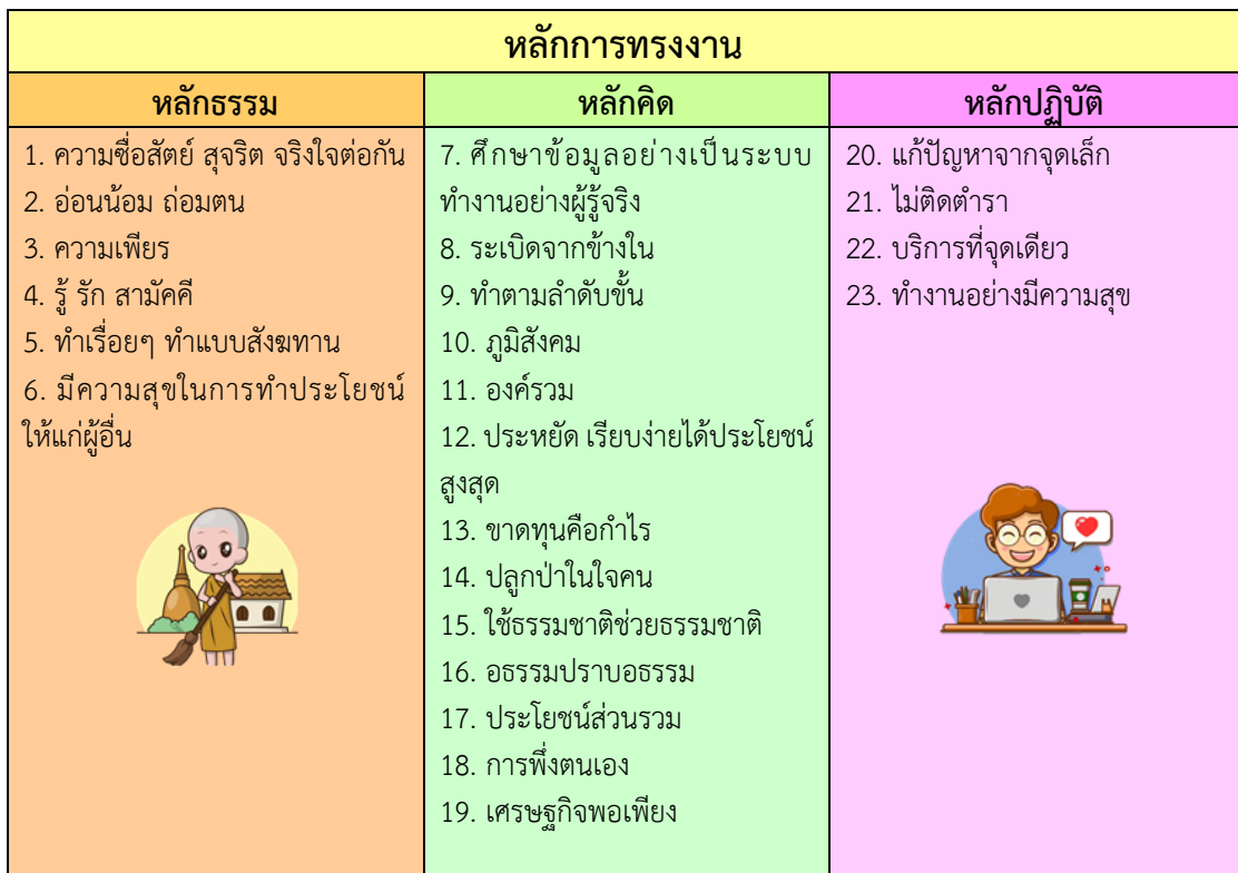
รูปที่ 3.6 สรุปหลักการทรงงานออกเป็น 3 แนวทาง