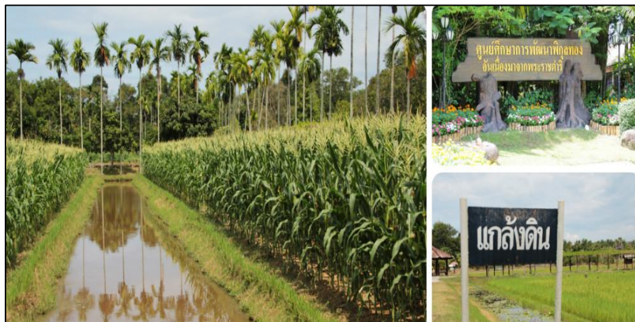
รูปที่ 3.8 ศูนย์ศึกษาการพัฒนาพิภพทองอันเนื่องมาจากพระราชดำริ อำเภอเมือง จังหวัดนราธิวาส

จากที่กล่าวมาจะเห็นได้ว่า พระบาทสมเด็จพระปรมินทรมหาภูมิพลอดุลยเดชบรมนาถบพิตร ทรงเน้นเสมอว่า การสอนควรยึดรากฐานเดิมของสังคมไทยไว้ ไม่ควรคัดลอกจากต่างประเทศมากเกินไป แต่อาจนำหลักการมาเปรียบเทียบได้ เพราะไม่เช่นนั้นจะทำให้ขาดความเป็นตัวของตัวเอง และที่ผ่านมามีพระองค์พระราชทานโครงการอันเนื่องมาจากพระราชดำริต่างๆ เป็นจำนวนมาก ซึ่งถ้าสนใจศึกษาโครงการฯ ที่พระองค์พระราชทานจะได้รับความรู้ที่ก่อให้เกิดประโยชน์มากมายสำหรับ การใช้ชีวิตของประชาชนในปัจจุบันท่ามกลางกระแส “บริโภคนิยม” ซึ่งมี “กิเลส” เป็นตัวกระตุ้น การมีพระราชดำริจัดตั้งศูนย์ศึกษาการพัฒนาอันเนื่องมาจากพระราชดำริที่มีครบทุกภาค ของประเทศ อันเป็นการนำตัวอย่างของการแก้ไขปัญหาตามหลักภูมิสังคม นับว่าเป็นแนวพระราชดำริ ที่จะสร้างคุณประโยชน์อย่างยิ่งต่อการศึกษาดูงาน เพื่อนำเอาสรรพสิ่งความรู้ที่พระองค์ได้ทรง ดำเนินการไว้ในส่วนของวิธีการแก้ปัญหา รายละเอียดการดำเนินงาน การใช้ประโยชน์จากหลักการที่ ได้พระราชทานไว้ รวมถึงการนำผลการวิจัยมาใช้ประโยชน์ โดยใช้ร่วมกับแนวทางตามภูมิสังคม เพื่อ คนรุ่นต่อไป สามารถนำมาปรับใช้ให้เป็นประโยชน์ต่อ