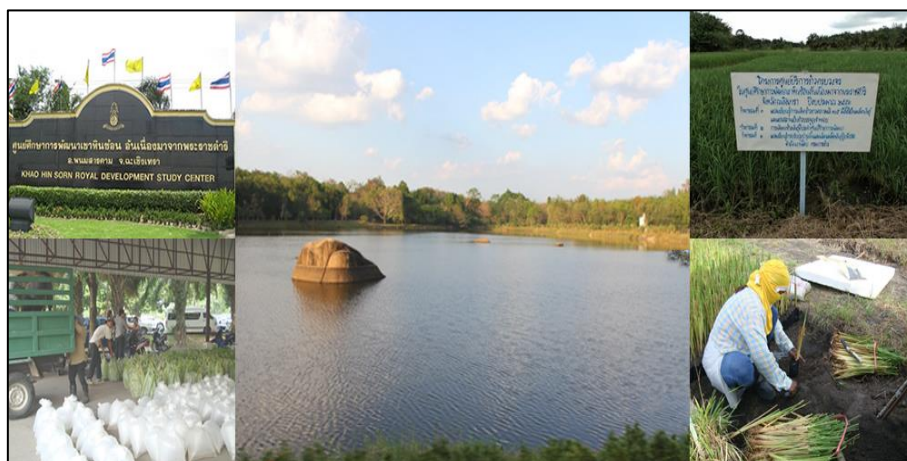
รูปที่ 3.7 ศูนย์ศึกษาการพัฒนาเขาหินซ้อนอันเนื่องมาจากพระราชดำริ อำเภอนมสารคาม จังหวัดฉะเชิงเทรา

ที่มา : http://www.tsdf.nida.ac.th/th/royally-initiated-projects/10831