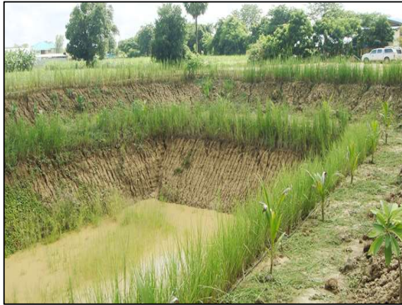
รูปที่ 3.6 ต้นหญ้าแฝกที่ยังมีชีวิตอยู่ สามารถใช้ประโยชน์ในด้านการอนุรักษ์ดินและน้ำตลอดจนการป้องกันสิ่งแวดล้อมและการบำบัดน้ำเสีย เป็นต้น