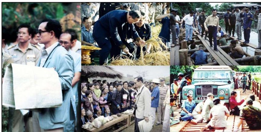
รูปที่ 3.4 พระราชกรณียกิจของพระบาทสมเด็จพระบรมชนกาธิเบศร มหาภูมิพลอดุลยเดชมหาราชบรมนาถบพิตร