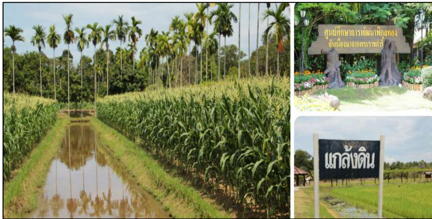
รูปที่ 3.8 ศูนย์ศึกษาการพัฒนาพิภพทองอันเนื่องมาจากพระราชดำริ อำเภอเมือง จังหวัดนราธิวาส ที่มา : http://www.tsdf.nida.ac.th/royally-initiated-projects/10831 สืบค้นวันที่ : 9 มิถุนายน พ.ศ.2566

จากที่กล่าวมาจะเห็นได้ว่า พระบาทสมเด็จพระปรมินทรมหาภูมิพลอดุลยเดช บรมนาถบพิตร ทรงเน้นเสมอว่า การสอนควรยึดรากฐานเดิมของสังคมไทยไว้ ไม่ควรคัดลอกจากต่างประเทศมากเกินไป แต่อาจนำหลักการมาเปรียบเทียบได้ เพราะไม่เช่นนั้นจะทำให้ขาดความเป็นตัวของตัวเอง และที่ผ่านมามีพระองค์พระราชทานโครงการอันเนื่องมาจากพระราชดำริต่างๆ เป็นจำนวนมาก ซึ่งถ้าสนใจศึกษาโครงการฯ ที่พระองค์พระราชทานจะได้รับความรู้ที่ก่อให้เกิดประโยชน์มากมายสำหรับ การใช้ชีวิตของประชาชนในปัจจุบันท่ามกลางกระแส “บริโภคนิยม” ซึ่งมี “กิเลส” เป็นตัวกระตุ้น การมีพระราชดำริจัดตั้งศูนย์ศึกษาการพัฒนาอันเนื่องมาจากพระราชดำริที่มีครบทุกภาค ของประเทศ อันเป็นการนำตัวอย่างของการแก้ไขปัญหาตามหลักภูมิสังคม นับว่าเป็นแนวพระราชดำริ ที่จะสร้างคุณประโยชน์อย่างยิ่งต่อการศึกษาดูงาน เพื่อนำเอาสรรพสิ่งความรู้ที่พระองค์ได้ทรง ดำเนินการไว้ในส่วนของวิธีการแก้ปัญหา รายละเอียดการดำเนินงาน การใช้ประโยชน์จากหลักการที่ได้พระราชทานไว้ รวมถึงการนำผลการวิจัยมาใช้ประโยชน์ โดยใช้ร่วมกับแนวทางตามภูมิสังคม เพื่อ คนรุ่นต่อๆ ไป สามารถนำมาปรับใช้ให้เป็นประโยชน์ต่อ