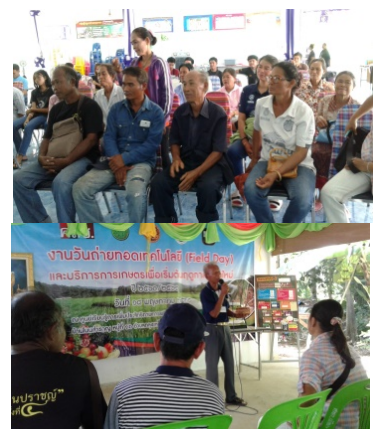
รูปที่ 1 การศึกษาดูงานชุมชนอื่นที่มีบริบททางสังคมที่ใกล้เคียงกัน

5.2 กระบวนการเรียนรู้ชุมชน พบว่า ชุมชนบ้านหนองขวาง ตำบลพรสำราญ อำเภอคูเมือง จังหวัดบุรีรัมย์ มีกระบวนการเรียนรู้ชุมชน แยกได้ 4 ระดับ ได้แก่ ระดับบุคคล เป็นกระบวนการเรียนรู้ที่เกิดจากความสนใจของบุคคลและผ่านการฝึกฝนจนมีความเชี่ยวชาญเฉพาะบุคคล ระดับครอบครัว เป็นกระบวนการเรียนรู้ที่สืบทอดองค์ความรู้จากบุคคลในครอบครัว หรือตระกูลจนเป็นที่ยอมรับของคนในชุมชนว่าตระกูลนั้นเด่นในเรื่องใดหรือมีความสามารถด้านภูมิปัญญาท้องถิ่นใด เช่น ครอบครัวพ่อเก่าทำมีด มีความสามารถด้านการจักสาน ระดับชุมชน เป็นกระบวนการเรียนรู้ตามวิถีวัฒนธรรมของชุมชนสื่อออกมาในลักษณะของงานบุญประเพณี ความเชื่อ และวิถีปฏิบัติของคนชุมชนหนองขวาง เช่น บุญผะเหวด บุญกฐิน การไหว้ปู่ตา เป็นต้น ส่วนในสมัยปัจจุบันมีการเรียนรู้ผ่านเครือข่าย เป็นการเรียนรู้ของชุมชนผ่านกิจกรรมโครงการของเครือข่ายหน่วยงานทางสังคมของชุมชน เช่น โครงการขององค์การบริหารส่วนตำบลพรสำราญ มหาวิทยาลัย โรงพยาบาล ส่งเสริมสุขภาพตำบล พัฒนาชุมชน เกษตรอำเภอ เป็นต้น ทำให้ชาวบ้านได้รับความรู้ใหม่ๆ เข้าสู่ชุมชน