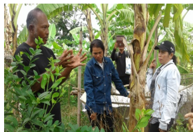
รูปที่ 3 พัฒนาความรู้ครอบครัวให้เป็นฐานเรียนรู้ชุมชน

นอกจากนี้ได้รวมกลุ่มด้านอาชีพภายใต้ชื่อ “กลุ่มอาชีพผู้สูงอายุชุมชนบ้านหนองขวาง” ร่วมกันออกแบบ โลโก้และแต่งตั้งคณะกรรมการ เพื่อพัฒนาต่อยอดงานวิจัยไปสู่การพัฒนาคุณภาพชีวิต ด้วยการประสานกับพัฒนาชุมชนตำบลพรสำราญ และพัฒนาชุมชนอำเภอคูเมือง กระบวนการกลุ่มจะทำให้ชุมชนเกิดการเรียนรู้ร่วมกัน เมื่อใดมีการเรียนรู้ในชุมชนจะกลายเป็นพลังชุมชนที่จะนำไปสู่ความเข้มแข็งส่งผลต่อคุณภาพชีวิตดีขึ้นของผู้สูงอายุ ข้อค้นพบการวิจัยสรุปกระบวนการเรียนรู้ของชุมชนเพื่อพัฒนาคุณภาพชีวิตของผู้สูงอายุชุมชนบ้านหนองขวางได้