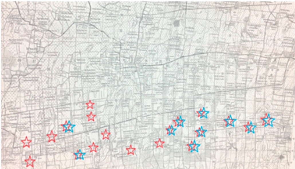
ภาพที่ 2 แสดงการกระจายตัวของครัวเรือนที่เป็นคนบ้านเดียวกัน

คนบ้านเดียวกัน ถือเป็นอีกหนึ่งทุนทางสังคม และขยายสู่การเป็นเครือข่ายทางสังคมจากภูมิภาคเนาเดิมสู่พื้นที่ใหม่ที่ชายแดน คนบ้านเดียวกันมีส่วนสำคัญในการชักชวนและตัดสินใจอพยพเข้ามารับการจัดสรรที่ดินกับนิคมสร้างตนเองด้วยเช่นกัน ในชุมชนไทยร่มเย็นพบเครือข่ายคนบ้านเดียวกันจากชุมชนหนองเกาะ อำเภอสตึก จังหวัดบุรีรัมย์ และเครือข่ายคนบ้านเดียวกันจากชุมชนตะคร้อ อำเภอกง จังหวัดนครราชสีมา อาศัยอยู่จำนวนหนึ่ง และกระจายตัวกันอยู่ในชุมชนชายแดนรัฐจัดตั้งใกล้เคียง แม้จะเป็นพื้นที่เสี่ยงอันตราย แต่การที่คนบ้านเดียวกันอพยพมาอยู่ร่วมกัน ทำให้รู้สึกอบอุ่นและปลอดภัยเหมือนอยู่หมู่บ้านเดิม ในช่วงแรกคนบ้านเดียวกันที่อพยพมาอยู่ก่อนจะให้การช่วยเหลือเรื่องที่พักและการสมัครสมาชิกนิคมสร้างตนเองกับคนบ้านเดียวกันที่เข้ามาภายหลังจนสามารถขยายที่อยู่อาศัยได้ จึงพบว่า คนบ้านเดียวกันกระจายตัวยึดโยงเป็นเครือข่ายทางสังคมตามชุมชนชายแดนรัฐจัดตั้งในชายแดนอำเภอบ้านกรวด จังหวัดบุรีรัมย์ ดังภาพที่ 2