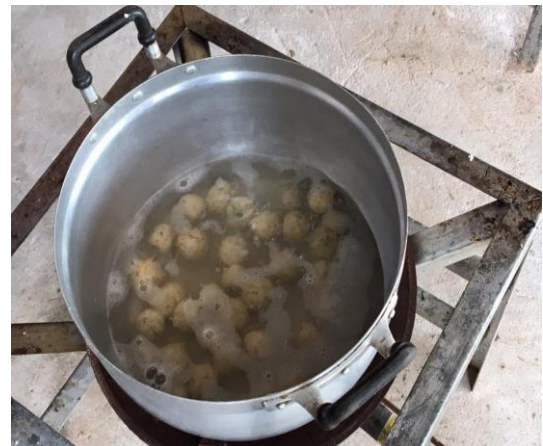
รูปภาพที่ 7 ทดลองปฏิบัติการ โดยการใช้ที่ค้นพบมาเพิ่มมูลค่าสินค้ากลุ่มพะเห็ดของชุมชนมาใช้กับสินค้าของชุมชน