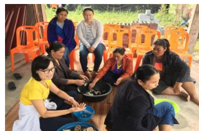
รูปภาพที่ 6 นักวิจัยร่วมกับชุมชนประชุมหารือเกี่ยวกับกระบวนการเพิ่มมูลค่าสินค้าและทำการสรุปผลเกี่ยวกับกระบวนการสร้างการเพิ่มมูลค่าสินค้าของกลุ่มเพาะเห็ดบ้านโพธิ์ชัย