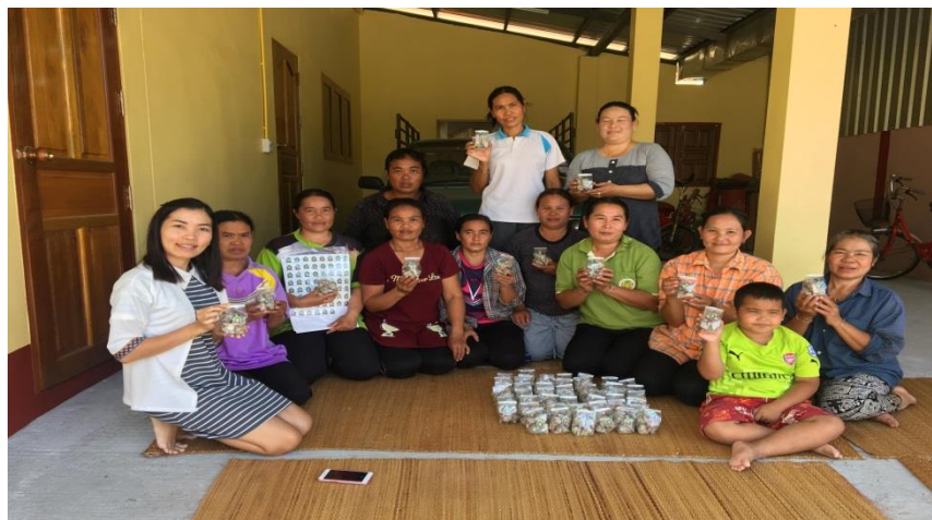
รูปภาพที่ 8 ทีมวิจัยร่วมกับชุมชนสรุป วิเคราะห์ สังเคราะห์ และคืนข้อมูลกระบวนการสร้างการเพิ่มมูลค่าสินค้าของกลุ่มเพาะเห็ดบ้าน โปธิชัย