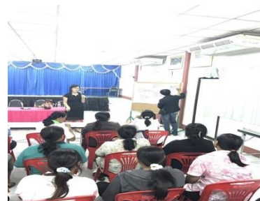
รูปภาพที่ 3 การประชุมชี้แจงวัตถุประสงค์โครงการวิจัย