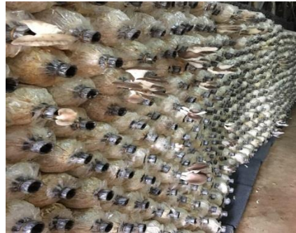
รูปภาพที่ 5 สํารวจสินค้าของชุมชนกลุ่มเพาะเห็ด และทำการวิเคราะห์ผลการสํารวจสินค้าของชุมชน

3.2 สรุปผลการสํารวจสินค้าของชุมชนที่มีความเหมาะสมที่จะนำไปสร้างเป็นสินค้าร่วมกับชุมชนบ้านโพธิ์ชัย จากการสํารวจสินค้าของบ้านโพธิ์ชัย ตำบลโพธิ์ชัย อำเภอวาปีปทุม จังหวัดมหาสารคาม สรุปได้ว่า สินค้าที่ต้องการนำมาทำการเพิ่มมูลค่าสินค้าเพื่อการพัฒนาเศรษฐกิจชุมชนอย่างยั่งยืนของบ้านโพธิ์ชัย คือ เห็ดนางฟ้า