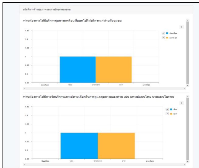
ภาพที่ 6 แสดงหน้าจอรายงานด้านสุขภาพและการรักษาพยาบาล

ตัวอย่างรายงานตัวที่ 1 รายงาน สถิติการด้านสุขภาพและการรักษาพยาบาล