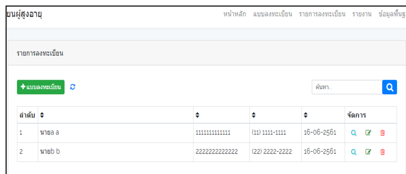
ภาพที่ 2 หน้าจอหลัก ลงทะเบียนผู้สูงอายุ

สามารถ เพิ่มข้อมูล ประวัติผู้สูงอายุ ลบผู้สูงอายุ แก้ไขผู้สูงอายุ เพิ่มข้อมูลความต้องการ ในด้านต่างๆ แก้ไขข้อมูลในด้านต่างๆ สามารถลงทะเบียน ผู้สูงอายุ บันทึกข้อมูลการลงทะเบียน ผู้สูงอายุ สามารถ เพิ่ม ลบ แก้ไข ข้อมูลได้