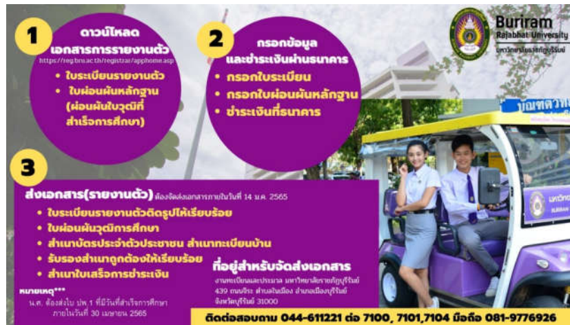
ภาพที่ 3: ขั้นตอนประชาสัมพันธ์ข้อมูลการรับรายงานตัวนักศึกษาใหม่ ผ่านช่องทางออนไลน์

วัตถุประสงค์การวิจัย ข้อที่ 2 เพื่อศึกษาระดับความพึงพอใจต่อกระบวนการรับรายงานตัวนักศึกษาใหม่ประจำปีการศึกษา 2565 รอบ เพิ่มสะสมผลงาน กรณีศึกษามหาวิทยาลัยราชภัฏบุรีรัมย์ ในสถานการณ์การแพร่ระบาดของไวรัสโคโรนา (COVID-19)