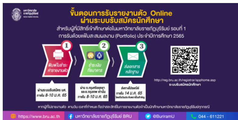
ภาพที่ 2: ขั้นตอนการรับรายงานตัวนักศึกษาใหม่ประจำปีการศึกษา 2565 รอบ แฟ้มสะสมผลงาน

3. การพัฒนาระบบสารสนเทศเพื่อให้ผู้รับรายงานตัวศึกษาข้อมูลและสามารถดาวโหลดเอกสารที่ใช้ในการรับรายงานตัว ได้แก่ 1) ข้อมูลเกี่ยวกับค่าใช้จ่ายในการรายงานตัวและพิมพ์เอกสารรับรายงานตัวผ่านลิงค์ https://reg.bru.ac.th/registrar/apphome.asp 2) การสร้าง QR code เพื่อเข้าถึงรับรายงานตัวนักศึกษา 3) การ Line official account เป็นช่องทางในการตอบคำถาม คำถามที่มีการถามบ่อย ซึ่งในระบบนี้จะทำให้ลดภาระการปฏิบัติงานของบุคลากรในการตอบคำถามผ่านออนไลน์ในระบบเพจของสำนักส่งเสริมวิชาการและงานทะเบียน โดยปกติจะมีบุคลากรที่ดูแลระบบคอยตอบคำถาม