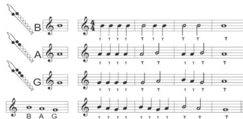
แบบฝึกหัดที่ 1 สำหรับการเป่าขลุ่ยรีคอร์เดอร์