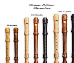
ภาพที่ 1 ส่วนประกอบของขลุ่ยรีคอร์เดอร์